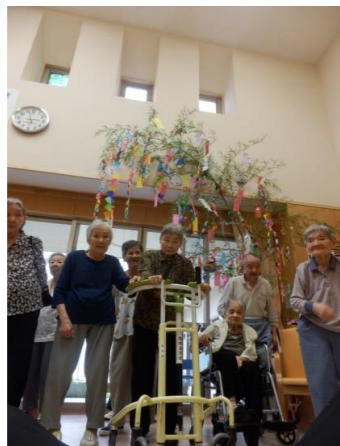
〈七夕飾りを作りました〉

た。ありがたいことです。 昨年度、人権研修の先生に教えていただいた「ありがとうの階級」。誰かに何かをやっても「ありがとう」と言えるのが初級。嫌な事・苦しい時病気の時でも「ありがとう」と言えるのが中級。何もない普段の生活にも「ありがとう」と言い続けられるのが上級との事。上級は無理としても、中級を目指して感謝の日々を送りたいものです。